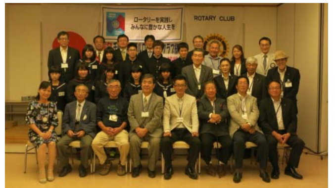
岩沼ロータークラブの例会に出席