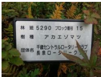
植樹したアカエゾマツは 約 150cm に成長していました