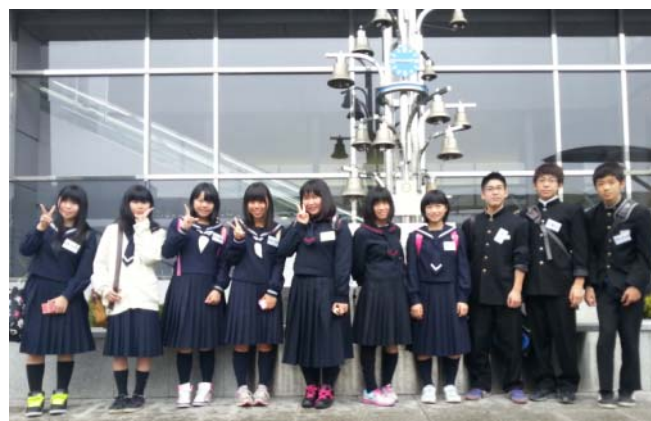
まだまだ緊張気味の生徒 カリオンの鐘にて (仙台空港)