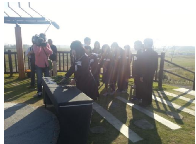
月命日だった 11 日、午後 2 時 46 分に “千年希望の丘”で海に向かって黙とう・献花を行いました