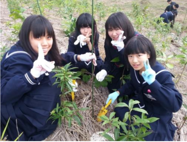
“千年希望の丘”で 20 本のヤマザクラを植樹