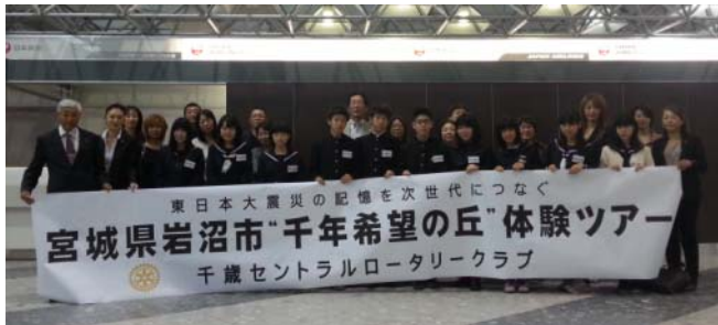
出発式/新千歳空港