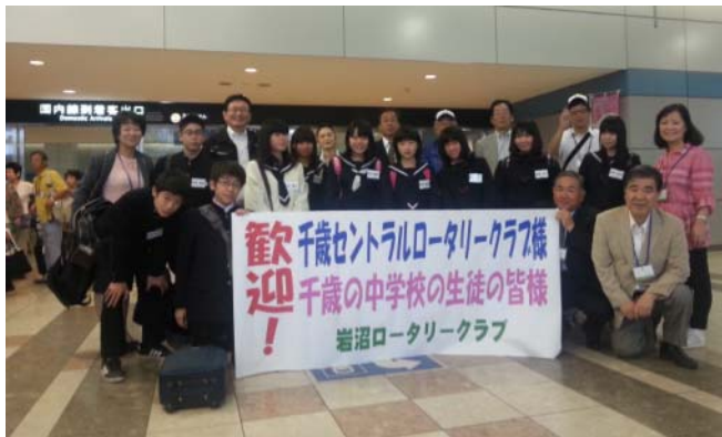
岩沼 RC の皆さんに出迎えていただきました 仙台空港にて