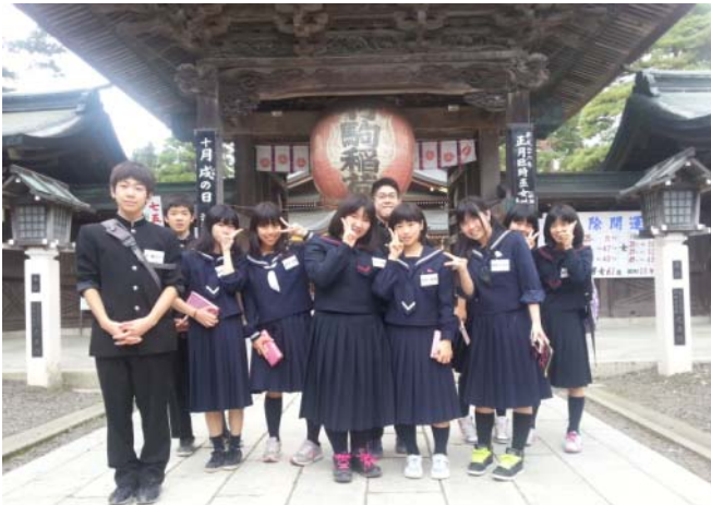
ここは観光で、“竹駒稲荷”