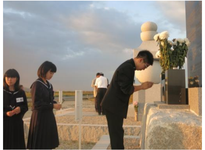
山元町中浜小学校の北側に建つ慰霊碑に手を合わせる生徒たち 中浜地区で犠牲になった住民 137 人の名前が刻まれています 鎮魂碑「千年の塔」も併設されています