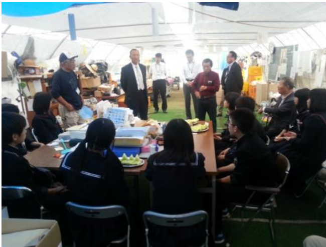
岩沼市相野釜ハウス園芸組合「メロンハウス」で震災当時の状況、 復興の状況などを伺いました。おいしいメロンも頂きました。