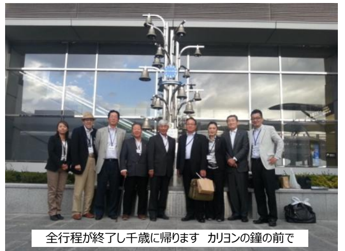
全行程が終了し千歳に帰ります カリヨンの鐘の前で