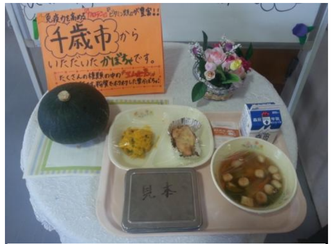
玉浦中学校で給食を在校生と一緒にいただきました