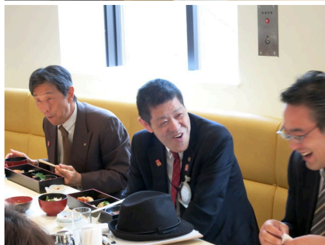
本日の食事会場はピアワークスちとせのレストランです。